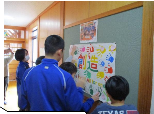
行動宣言文の作成