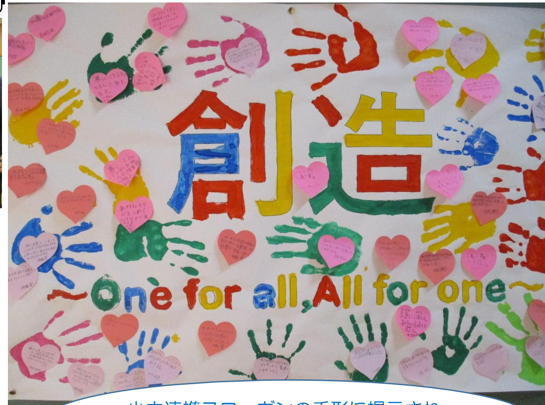
小中連携スローガンの手形に掲示された「行動宣言文」