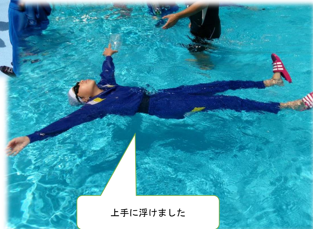
上手に浮けました