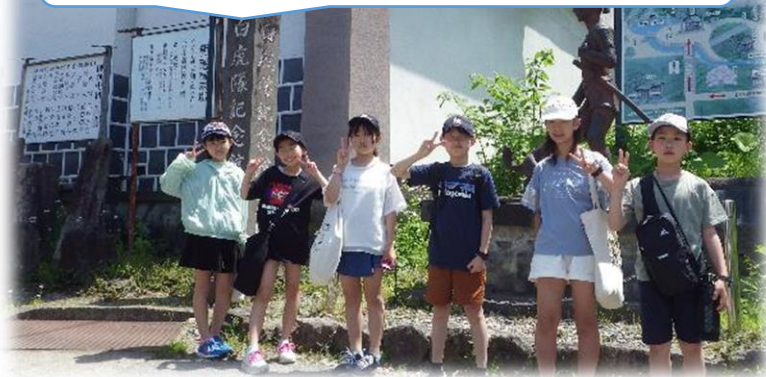
飯盛山見学からスタート

1日目は、飯盛山見学～赤べこ絵付け体験・昼食（ソースかつ丼）～七日町通散策（買い物）～鶴ヶ城見学（買い物）というコースでした。裏磐梯レイクリゾートはきれいでみんなびっくりでした。