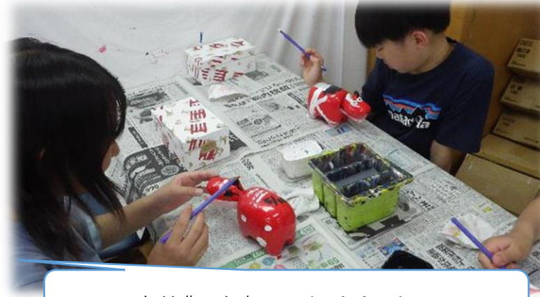
個性豊かな赤べこができました。