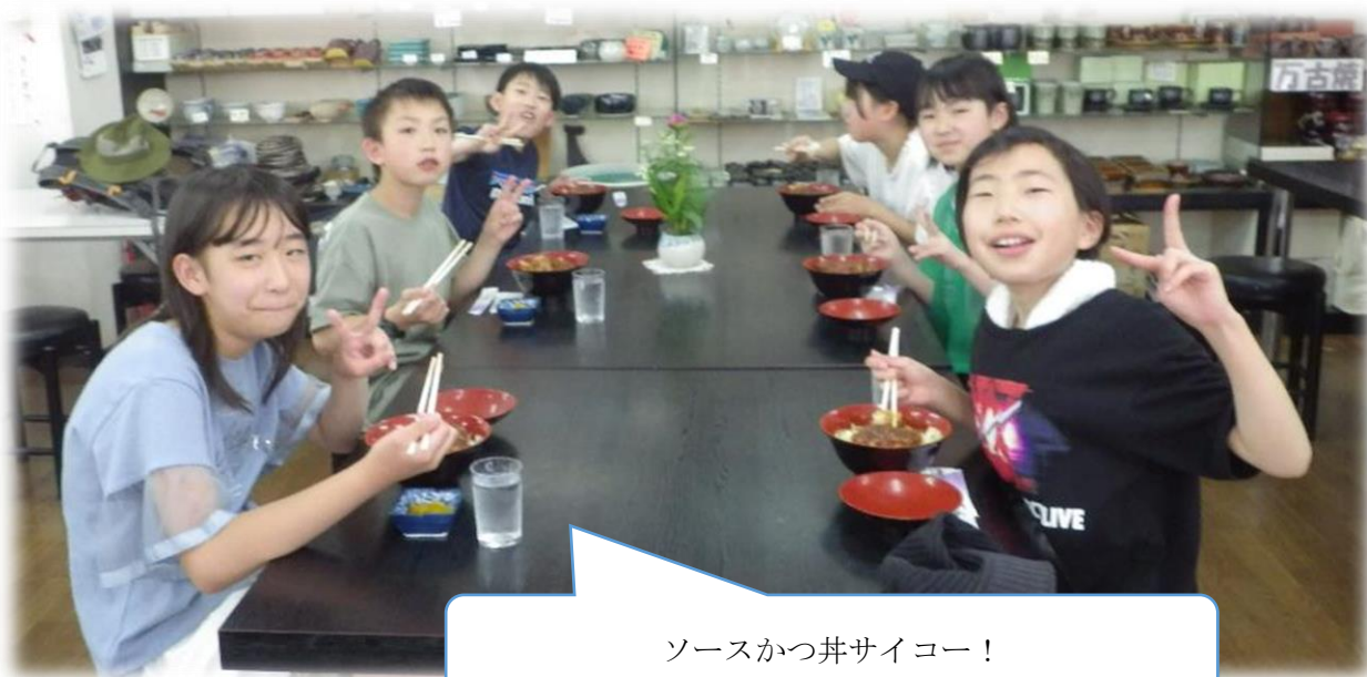
ソースかつ丼サイコー！