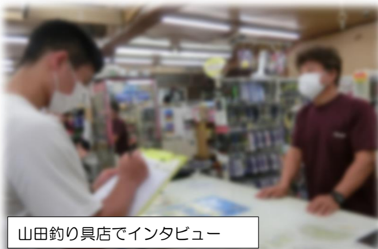
山田釣り具店でインタビュー