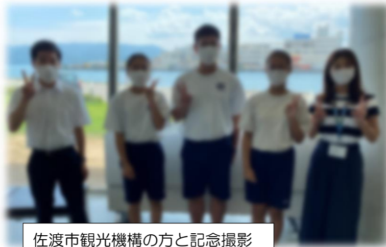
佐渡市観光機構の方と記念撮影

8月30日、31日の2日間行われ2、3年生が参加しました。今回の課題は、「佐渡の「ピーター」をつくる『人』に会いに行き、取材を通して佐渡の魅力を探る」というものでした。