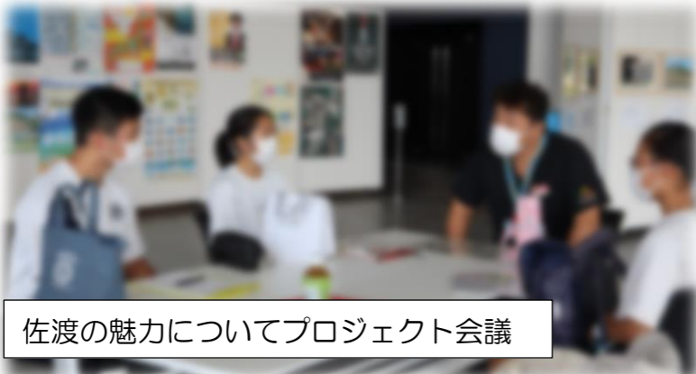
佐渡の魅力についてプロジェクト会議