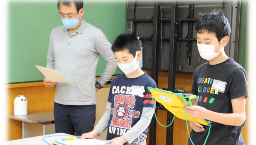
高学年が進行をがんばりました。