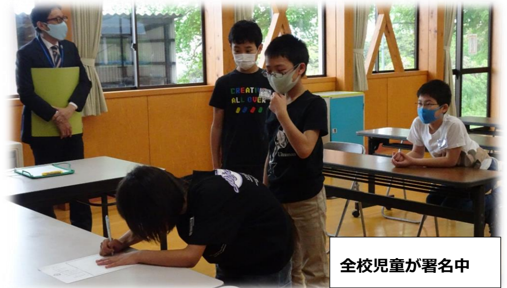
全校児童が署名中